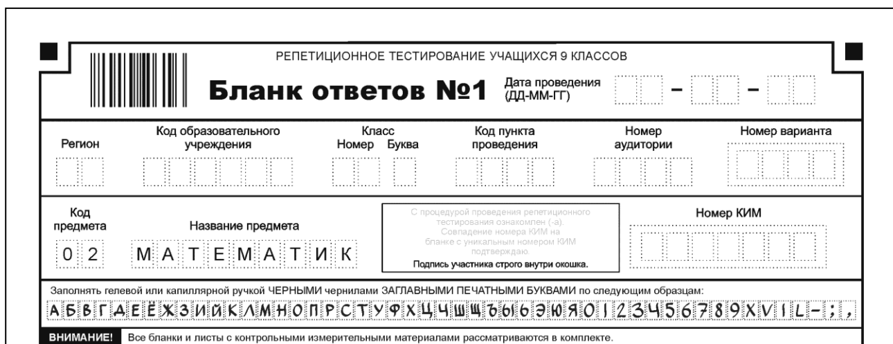
Рис. 1. Верхняя часть бланка ответов № 1

В верхней части бланка ответов № 1 (рис. 1) расположены горизонтальный штрихкод, поля для заполнения участником ГИА, поле для подписи участника ГИА, строка с образцами написания символов.